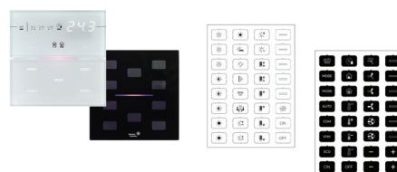
Multifunktionale Bedienelemente mit anwendungsspezifischen Symbolen

Mit den kapazitiven Bedienelementen mit hochwertigen Glasoberflächen steht ein wandelbares und optisch ansprechendes Design zur Verfügung, mit dem sich individuelle und projektspezifische Bedienelemente auf einfache Weise realisieren lassen.