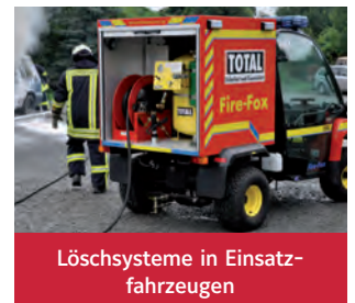
Löschsysteme in Einsatzfahrzeugen