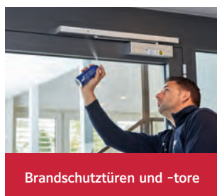
Brandschutztüren und -tore