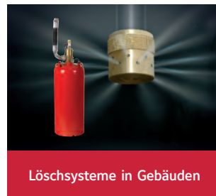
Löschsysteme in Gebäuden