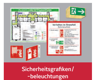
Sicherheitsgrafiken / -beleuchtungen