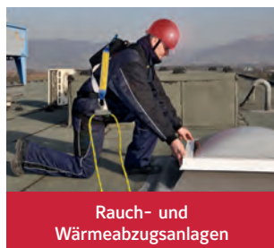
Rauch- und Wärmeabzugsanlagen